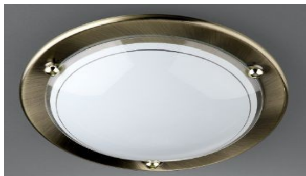
707001106 patyna Cena: 96,-