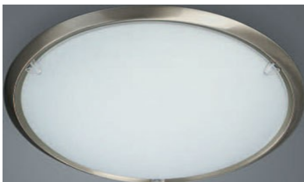
770501117 satyna Cena: 96,-