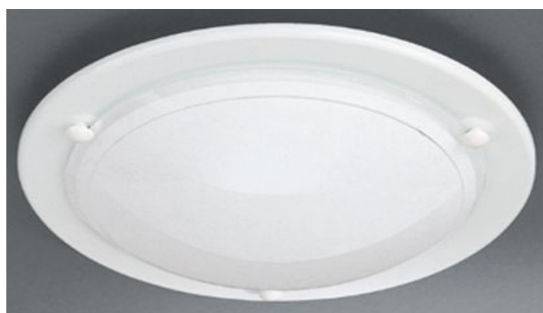
707001131 biała Cena: 96,-