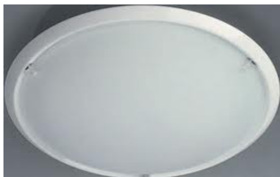
770501131 biała Cena: 92,-

IP-20 podstawa metalowa, klosz szklany Wymiary: 310/80