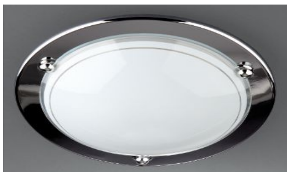
707001111 chrom Cena: 96,-

IP-20 podstawa metalowa, klosz szklany wymiary 310/80