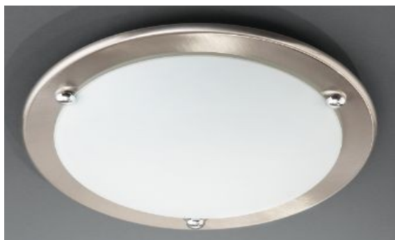
707001117 satyna Cena: 96,-